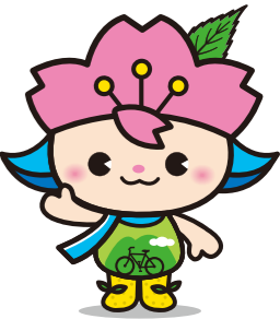
桜川市マスコットキャラクター さくらりん

※当日開催の可否は、市ホームページに掲載してお知らせいたします。(当日午前7時30分から)