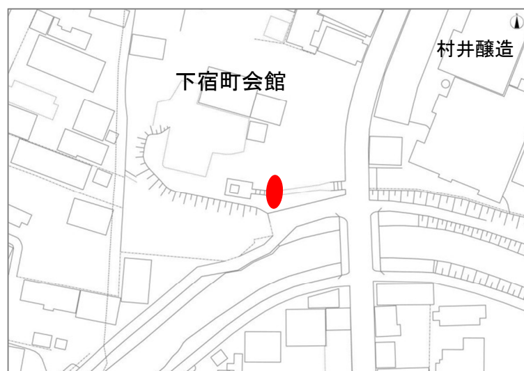
工作物位置図（工一下 07）