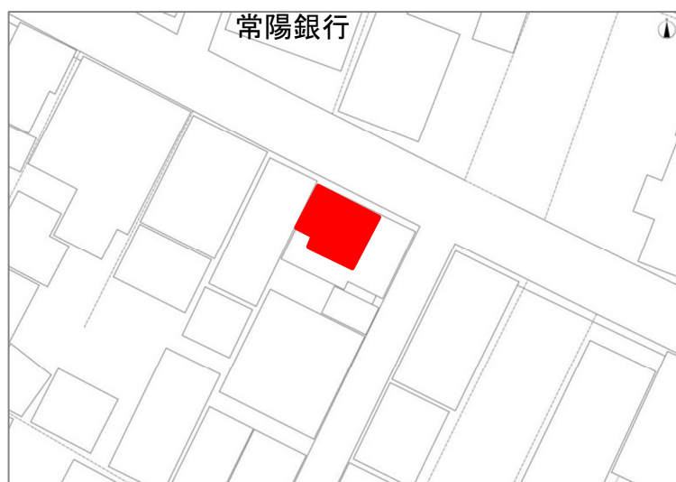
建築物位置図(建一仲25)