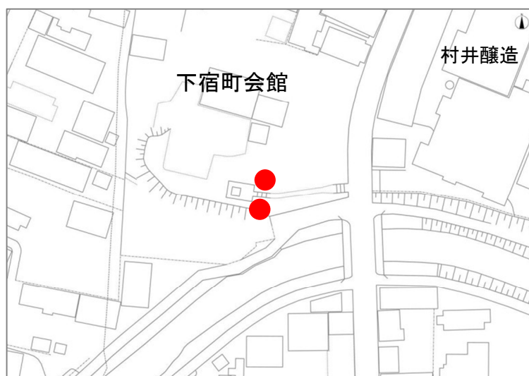
工作物位置図（工一下 08）