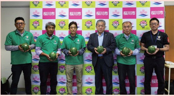
旬のこだまスイカを手にPR

同部会の皆さんは、5月から6月にかけて出荷のピークを迎えるこだまスイカのPRを行うとともに、各市場での取り扱い状況や販売実績のほか、行っているPR活動内容