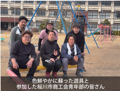
色鮮やかに蘇った遊具と 参加した桜川市商工会青年部の皆さん