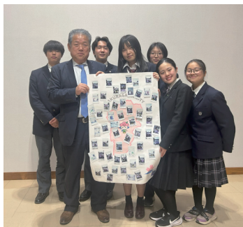
市長と記念撮影をする昨年度のメンバー

桜川みらいプロジェクトは、市内在住または市内の高校に通う高校生が、地域の魅力や可能性を自分たちの視点で考え、実際のまちの中で企画や活動に取り組みプロジェクトです。昨年度は、まち歩きやフィールドワーク、地域で活躍する方へのインタビュー、ひなまつりイベントでの企画・運営などを行い、「桜川で出会った人マップ」を制作しました。活動の締め