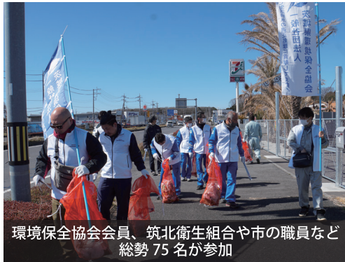
環境保全協会会員、筑北衛生組合や市の職員など 総勢75名が参加

本事業は不法投棄物の発見・撤去・回収を目的としており、県内の市町村を対象に毎年度2回実施されています。当日は、不法投棄監視パトロールでは21箇所での不法投棄物を発見、道路清掃ではポイ捨てごみ約30kgを回収することができました。