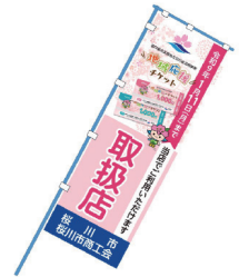
▲取扱店の目印はコチラ

●税金、公共施設利用料、手数料、公共料金 ●株式、保険、宝くじなどの金融商品、たばこ ●切手、印紙、図書券、ビール券など換金性の高いもの ●そのほか市が定めるもの