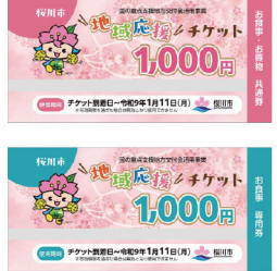
▲桜川市地域応援チケット