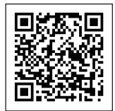
▲気象庁ホームページ