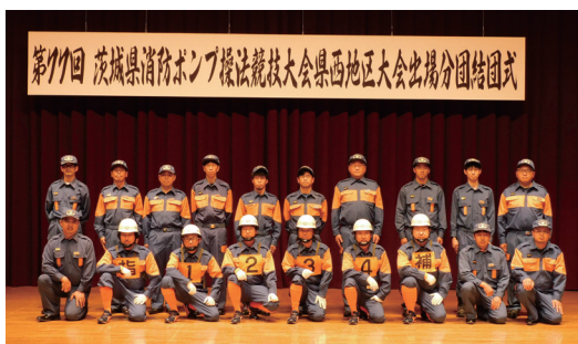
出場選手および出場分団の皆さん

「大会出場に向け、桜川市の誇りを持つて精一杯取り組み」と力強い決意を表明しました。