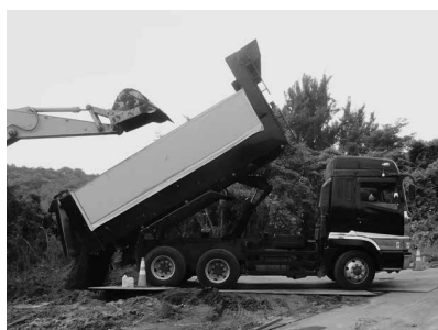
深ダンプ (深枠、デカ箱などと言われています)

■不法投棄110番 ☎0120-536-380 (平日8時30分～17時15分) ※受付時間外は最寄りの警察署まで