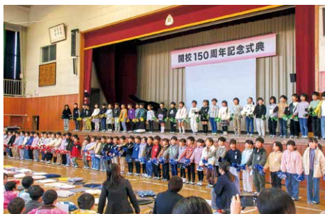
150周年記念式典の様子