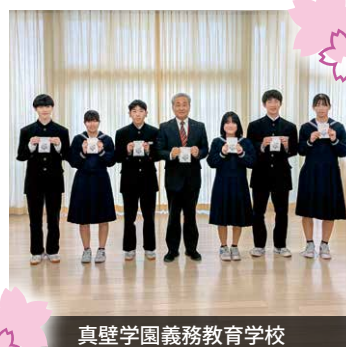
真壁学園義務教育学校