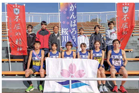
各区分を走り抜けた選手とチームの皆さん

12月13日、令和7年度第42回茨城県民駅伝競走大会、市町村対抗の部(6区間約18km)が、笠松運動公園(ひたちなか市)で開催され、桜川市チームが出場しました。 この大会は、参加者相互の親睦を図り、茨城県のスポーツ振興と、競技力の向上を目的に開催されているもので、市町村対抗の部には、21チームが参加しました。 桜川市チームは、監督、コーチ、選手一丸となってタスキを繋ぎ完走しました。