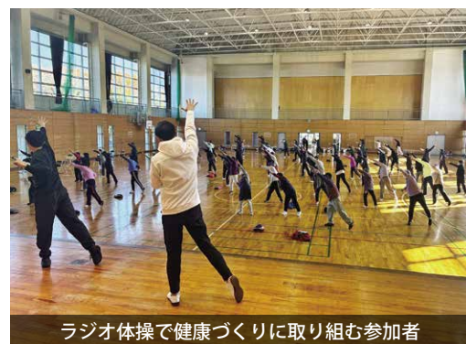
ラジオ体操で健康づくりに取り組む参加者

「健康タウン構想の推進」 ラジオ体操講習会を実施 「健康タウン構想の推進」ラジオ体操講習会が真壁体育館で開催され、参加者が爽やかな汗を流しました。 この取り組みは、簡易保険加入者協会の支援を受け、ラジオ体操の普及を通じ、健康な身体づくりと地域コミュニティの実現を図る目的で実施されています。 当日は、多くの市民が参加し、体操のポイントを意識しながら実践していました。