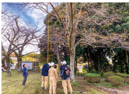
木の高さを計測する生徒

調査では、樹木医の指導のもと、測定器具の使い方を学びながら、一本一本慎重に調査しました。