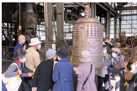
800年の歴史を持つ小田部鋳造の梵鐘

11月12日に開催されたジオツアーでは、18名の参加者が真壁・笠間のジオパークに関連する場所を訪れました。市内では、創業800年の歴史を持つ鋳物工場である小田部