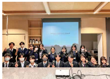
ワークショップに参加した高校生

た一方で、交通の不便さや若者向けのスポットの不足といった課題が指摘されました。また「こんな桜川になつたらいいな」というテーマでは「特産品をもっと増やす」「りんりんロードを活用した観光」「地域の人々と触れ合うイベントの実施」など、ポジティブな未来像が数多く発表され、若者ならではの視点で桜川市の魅力を引き出すアイデアが目立ちました。 参加者からは「同世代と地域のことを話すのが新鮮だった」といった感想がべられ、次回に向けた意欲を見せていました。