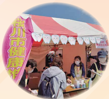
■SAKURA フェスティバル 市民祭で歯周病予防に関する啓発を実施しました。