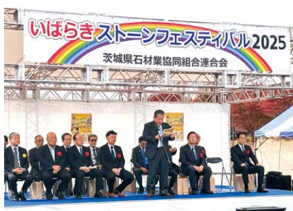
開会式で祝辞を述べる大塚市長