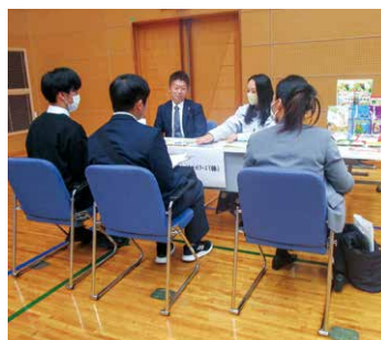
企業ブースで説明を聞く参加者

11月9日、大和ふれあいセンター「シトラス」にて、合同企業説明会を開催しました。今回の説明会では、高校生や今年度卒業予定の学生に加えて、市内で働きたい20代～30代の転職希望者が割合の多くを占めていました。製造業やサービス業、福祉事業や農業など、市内に事業所を有する企業・団体11社が参加。各社のブースでは、自