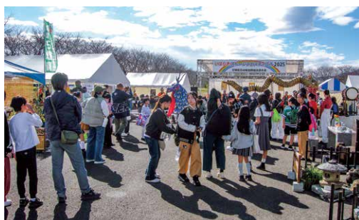
多くの来場者で賑わう会場

ジストーン（天然石材遺産）に認定されたことを受け、今回は「ヘリテージストーンと触れ合う3日間」と題し、茨城県産の石材を発信するフェスティバルとなりました。採石場を間近で見ることのできる石山見学バスツアーや、石割り、石積み、石燈籠づくりの実演、ストーンアート体験などが行われ、約7,500名が来場し、会場は賑わいました。