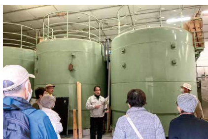
筑波山水系の伏流水を使って酒造りを行う西岡本店

鋳造や、日本酒「花の井」の蔵元である西岡本店を見学し、昼食は筑波山地域ジオブランドにも認定されている見晴らしの丘真壁うり坊の「うりの山芋定食」を堪能しました。