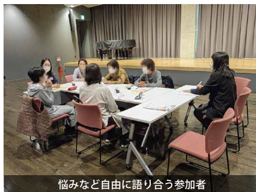
悩みなど自由に語り合う参加者

桜川市生涯学習センター「さくらす」で認知症の方を日々、介護しているご家族が集まり交流会を行いました。同じ境遇にある仲間だからこその合える悩みや対応方法、気持ちの切替え方などを自由に語り合いました。参加者からは「皆も頑張っているから、自分も頑張らないと」など前向きな気持ちになれたという意見が聞かれました。