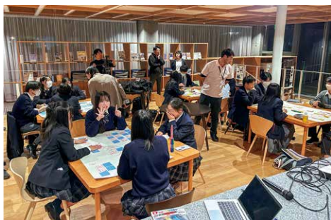
班ごとに意見を出し合う高校生

「桜川市ってどんなところ」というテーマでは、自慢できるところとして自然や歴史に関連する内容が多く挙げられ