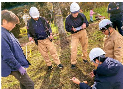
樹木医から指導を受ける生徒生徒

この活動は、官学連携協定に基づく授業の一環として実施されているもので、公園内に植えられているヤマザクラの樹高や幹周、成長状況などを丁寧に観察・記録しました。