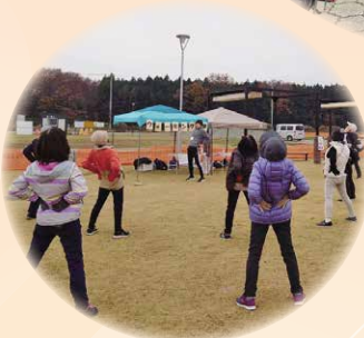
■健康教室(ウォーキング教室)に参加 正しい姿勢や歩き方を学び、楽しく体を動かしました。日ごろから無理なく続けられる健康づくりの大切さを感じました。