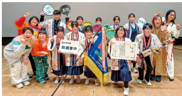
ゲストとの記念撮影に臨む岩瀬東中学校の生徒の皆さん

この大会では、県内市町村の代表校が県内各地の郷土検定問題に挑みました。日頃の練習の成果が発揮されました。