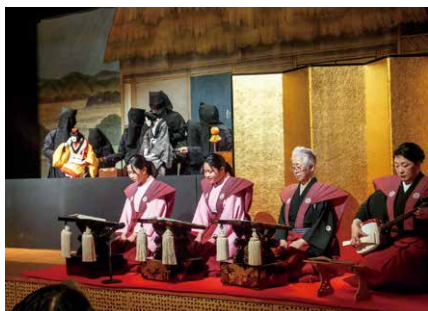
人形浄瑠璃 真壁白井座保存会

※その他次の4団体を加えた8団体が桜川市伝統民俗芸能連絡協議会に加盟しています。 ■宮大杉囃子保存会(大国玉) ■真壁御囃子保存会常陸真壁 ばやし連(真壁町真壁) ■西小埜けら踊り保存会(西小埜) ■青木大杉囃子保存会(青木)