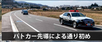
パトカー先導による通り初め