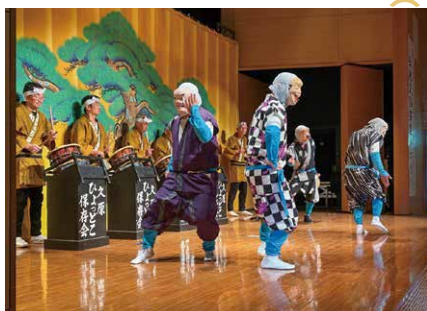
久原ひよつとこ保存会