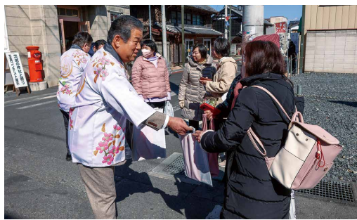
来訪者に観光パンフレットなどを手渡す大塚市長

1人でも多くの方に桜川市を知ってもらおうと、市の法被姿で、来訪者に観光パンフレットなどを手渡し、市をPRしました。