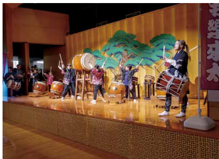
加波山囃子保存会

2月16日、真壁伝承館で桜川市伝統民俗芸能連絡協議会主催の第12回伝統民俗芸能のつどいが開催されました。今年には真壁のひなまつり期間に合わせての開催となり、市内で伝統民俗芸能を継承する4団体が、地域に伝わる踊りやお囃子などを披露しました。当日は多くの観客で賑わいました。