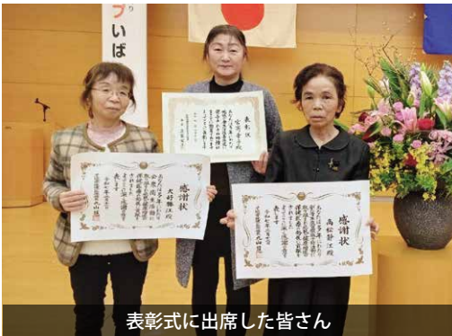
表彰式に出席した皆さん