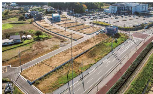
東側（県道東山田岩瀬線）から撮影

現在、未売約の土地について、3次募集を行っています。募集期限は、12月31日（火）となりますので、購入をご検討の方は、お早めにお問い合わせください。お申込みは、市ホームページ内の申込みフォームをご利用ください。