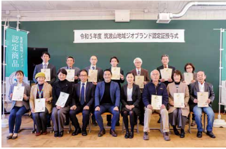
認定証授与式に出席された皆さん

今年度は、3年間の認定期間が満了し更新された16品と、新たに認定された6品の合計22品が認定となりました。