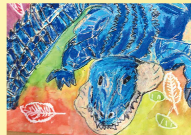
※入選 たかまつ 高松 せいや 征也(羽黒小2年)