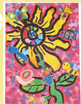
※入選 わたなべ 渡邊 みづき 美月(大國小1年)