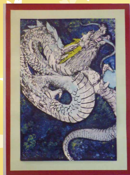
※入選 おほやま 大山 けい 結菜(樺穂小6年)