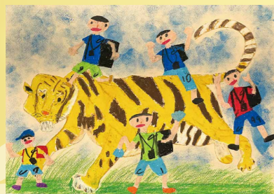
※入選 ひろさわ 廣澤 たいが 虎雅(南飯田小1年)

※各コンクールで受賞された一部の作品を紹介しています。紙面の都合上、掲載ができなかった作品もありますので、ご了承ください。