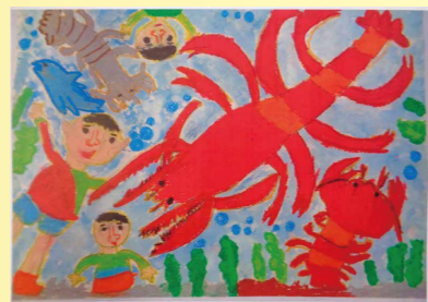
※入選 こやま 小山 かいと 海翔(坂戸小1年)