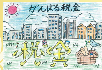
※下館税務行政協力団体連絡協議会長賞 ながほり 永堀 朔(南飯田小6年)