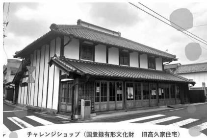
チャレンジショップ（国登録有形文化財 旧高久家住宅）