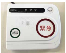
高齢者あんしん通報システム