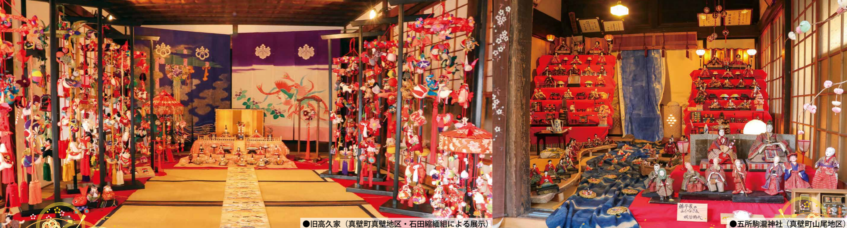
●旧高久家 (真壁町真壁地区・石田縮緬組による展示)