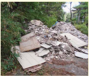
山林に不法投棄された建築廃材など