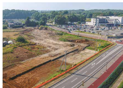
土地造成の様子（令和5年10月20日時点）

今年7月から土地の造成工事が開始されました。現在は、段階的な土の搬入と敷き均し作業が行われており、令和6年3月の造成完了を目指しています。造成完了後は、完了検査などの手続を経て、同年5月以降土地引渡しをする予定です。