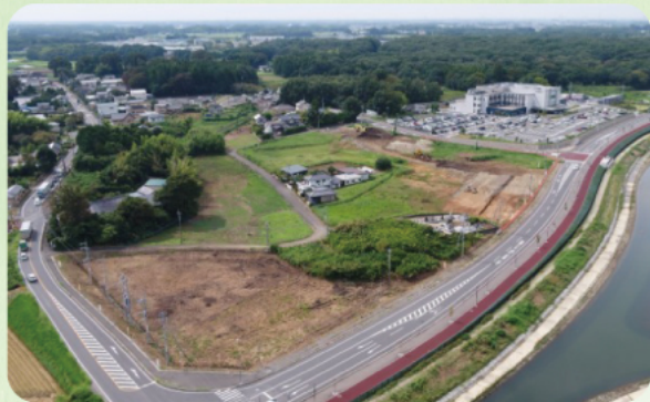
造成エリア全景 (R5.9月時点)

桜川市HP内の申込みフォームよりお申し込みください。詳細は、右の二次元コードよりご参照ください。