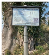
QRコードon立て札 (イメージ写真)

・文化財課のHP: https://www.city.sakuragawa.lg.jp/page/page006692.html