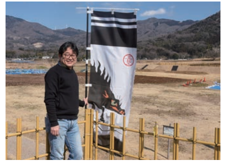
もうすぐ見渡す限り緑になります