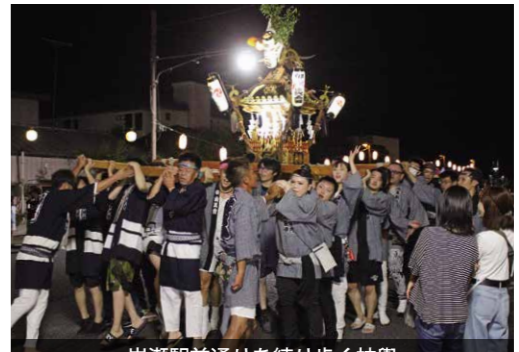
岩瀬駅前通りを練り歩く神輿

JR岩瀬駅前通りを中心に、岩瀬駅前夏祭りが開催されました。この祭りは、昭和20年代後半に岩瀬東区・西区、犬田地区で子どもたちに楽しんでもらうことを目的に始まったものです。過去3年間は新型コロナウイルス感染症により中止となっていました。今年、4年ぶりの開催となり、神輿と山車が通りを賑やかに練り歩きました。