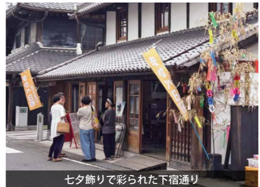
七夕飾りで彩られた下宿通り

下宿通り（真壁町真壁地区）で「まかべ日和」が開催されました。当日は、ハンドメイドシヨップやワークシヨップ、キッチンカーなどが出店し、普段は静かな下宿通りが多くの人で賑わいました。また、七夕を兼ねた今回は、通りに設置された笹の葉に、願いを込めた短冊を結び、真壁の町並みが鮮やかに彩られていました。