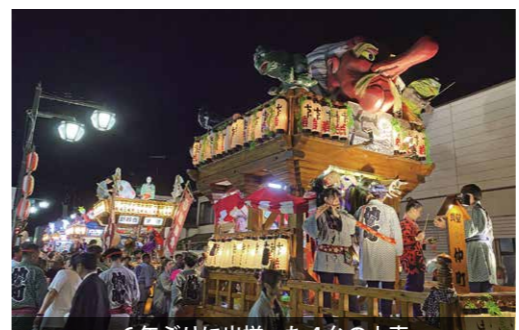
6年ぶりに出揃った4台の山車

約400年の歴史をもつ真壁祇園祭が開催され、真壁の伝統的な町並みに6年ぶりに4台の山車が揃い、若衆たちが勇壮に引き廻しました。23日に五所駒瀧神社を神輿行列が出発し、24日からは高上町・仲町・新宿町・上宿町の若衆たちによる山車の引き廻しが行われ、26日の神輿還御により幕を下ろしました。祇園祭には例年以上に観光客も訪れ、賑わいをみせました。