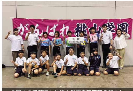
全国大会で健闘した桃山学園自転車部の皆さん

東京ビックサイトで行われた第55回交通安全子供自転車全国大会に、県大会で優勝した桃山学園が茨城県代表として出場しました。この大会は、1チーム4人組で交通規則などの学科テストと、実技テストの成績で競うもので、当日は全国から44チームが出場。上位入賞は果たせませんでしたが、持てる力を十分発揮した大会になりました。