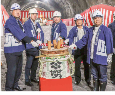
鏡開きを行う関係者の皆さん