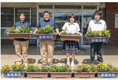
市役所大和庁舎にマリィゴールドなどを届けた真壁高校農業環境緑地科の皆さん

真壁高校 から、農業環境緑地科の生徒が育てたマリィゴールド・ニチニチソウ・ガザニアが寄贈され、市役所各庁舎の玄関などに飾られました。