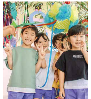
みんなで楽しく飾りつけ

表紙は7月7日、岩瀬認定こども園で、七夕の飾りつけを行う園児たちを撮影したものです。