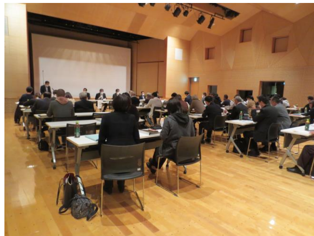
↑ 第1回真壁地区学校統合準備委員会の様子

その後、5月には、「真壁地区学校の統合に関する保護者アンケート調査」を実施し、市の総合教育会議を経て、桜川中学校区の学校と桃山学園の統合を推進することとなりました。