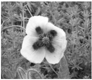
違法なけしや大麻草の例

疑いのあるものを見つけたときは、最寄りの保健所へご連絡ください。 ■問合せ／筑西保健所衛生課（☎0296-24-3913）