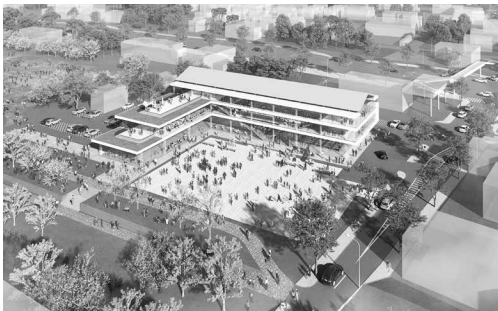
（仮称）桜川市複合施設鳥瞰イメージ図

市民の皆さまには工事期間中ご迷惑・ご不便をおかけしますが、安全に十分配慮したうえ工事を行いますので、ご理解とご協力をお願いします。