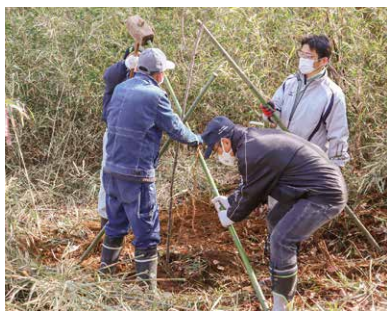
ヤマザクラの植樹

この事業は、ヤマザクラの植樹や育成、植樹地の環境美化活動を行う行政区や市民団体に、ヤマザクラの苗木などの支給や活動助成金の交付を行い、貴重な地域資源であるヤマザクラが咲き誇る美しい里山の景観を作ることを目的としています。