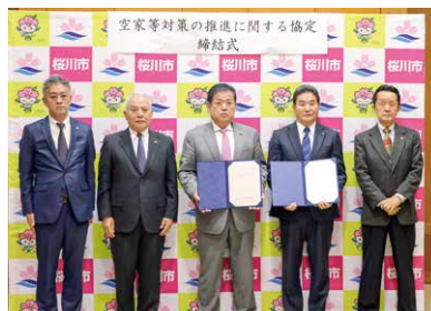
茨城県宅地建物取引業協会の皆さんと大塚市長