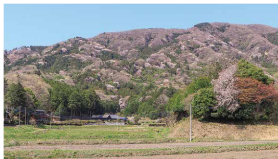
ヤマザクラの咲く里山の景観

昨年度は、14団体から申請があり、市内の多くの場所でヤマザクラの植樹や、環境美化活動が行われました。