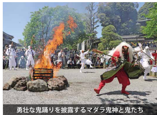
勇壮な鬼踊りを披露するマダラ鬼神と鬼たち

境内では、勢い良く燃え上がる炎を中心に、マダラ鬼神と鬼たちの鬼踊りが披露されました。