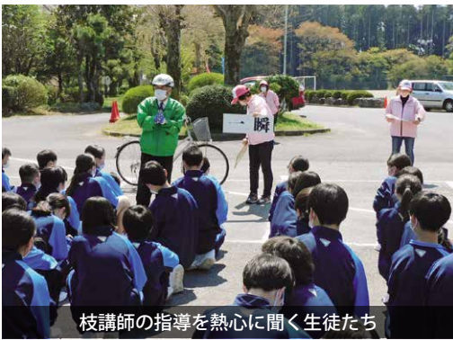
枝講師の指導を熱心に聞く生徒たち