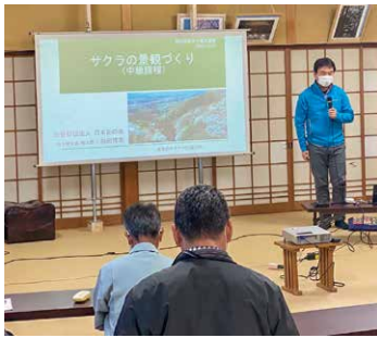
サクラや山桜の魅力を学ぶ

本市は、古来より「西の吉野、東の桜川」と称されるほどのサクラの名所であり、市内の山々には、約55万本のヤマザクラが自生しています。市では、その素晴らしい景観を後世に残し、伝えていく「桜守」を育成するため、桜守養成講座を定期的開催しています。