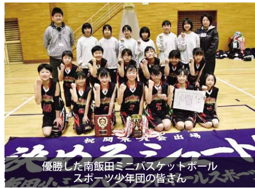
優勝した南飯田ミニバスケットボールスポーツ少年団の皆さん

選手たちは「みんなで頑張った結果です。次の目標に向かって、毎日の練習を頑張ります。」と話していました。