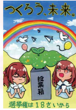
※入選 野澤 くるみ (坂戸小6年)