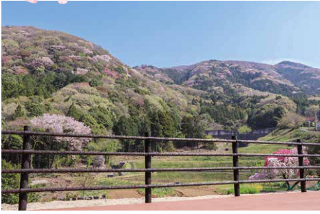
見晴デッキから望む高峯のヤマザクラ

標高520mの高峯には、数多くのヤマザクラが自生しています。 ヤマザクラはソメイヨシノに比べ、開花時期が遅く、ヤマザクラのピンク、新芽の深紅、新緑がまるでパッチワークのように山肌を彩ります。 麓の見晴デッキ、中腹には展望デッキがあり桜の里山風景が楽しめます。