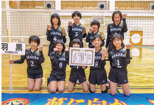
羽黒バレーボールスポーツ少年団

羽黒バレーボールスポーツ少年団は「チームワーク」をモットーに子どもたち一人一人が常に目標を高く持って楽しく活動しています。