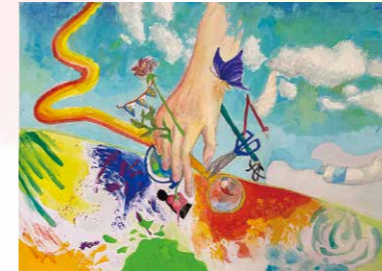
※入選 仲田 結柚 (岩瀬西中2年)