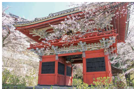
雨引観音(雨引山楽法寺)

坂東三十三観音霊場の札所で、四季折々の花が咲く花の寺です。 河津桜やソメイヨシノなど約3,000本のサクラが境内を彩り、春には雨引観音桜祭も開催され、ライトアップも実施されています。 サクラの種類も多く、長期間楽しむことができることが魅力です。