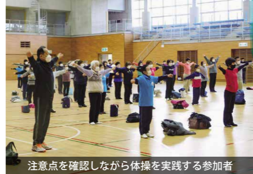
注意点を確認しながら体操を実践する参加者

「健康タウン構想」の推進 ラジオ体操講習会を開催 「健康タウン構想」の推進ラジオ体操講習会が、岩瀬体育館「ラスカ」で行われました。 この講習会は、簡易保険加入者協会の支援を受け、ラジオ体操を活用して健康な身体づくりと、明るい地域社会づくりを進めることを目的として開催されています。 当日は、約120名の方が参加し、健康づくりに心地よい汗を流しました。