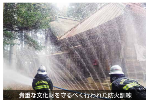
貴重な文化財を守るべく行われた防火訓練

文化財防火デー 鹿島神社で防火訓練を実施 県指定文化財である鹿島神社（真壁町上谷貝地区）で桜川消防署、桜川市消防団、地域住民約50名による防火訓練が行われました。 この訓練は、貴重な文化財を災害から守るため定められている、文化財防火デーに合わせ毎年実施されています。 当日は、社殿を火災から守る延焼防止訓練や消火器を使った初期消火訓練を行い、文化財愛護の意識を高めました。