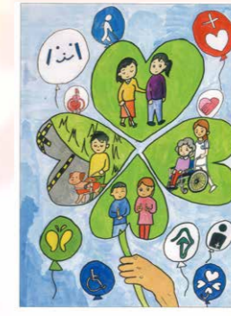
※内閣府佳作 成田 葉乃歌 (雨引小6年)