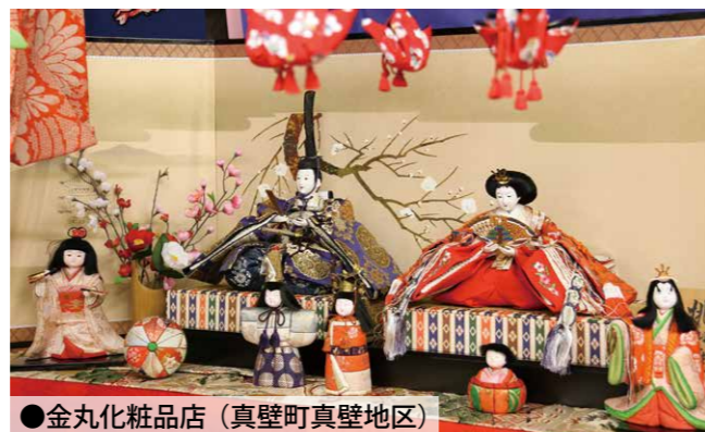
●金丸化粧品店(真壁町真壁地区)