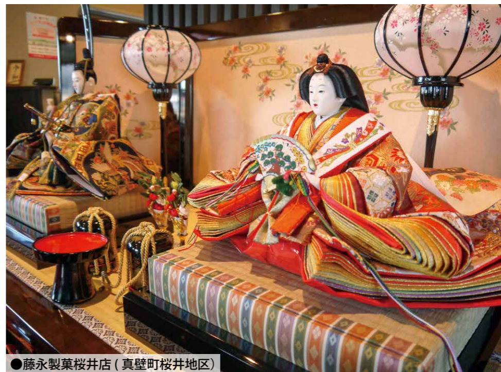
●藤永製菓桜井店(真壁町桜井地区)

■問合先/真壁のひなまつり実行委員会事務局 (商工観光課 ☎0296-55-1159直通)