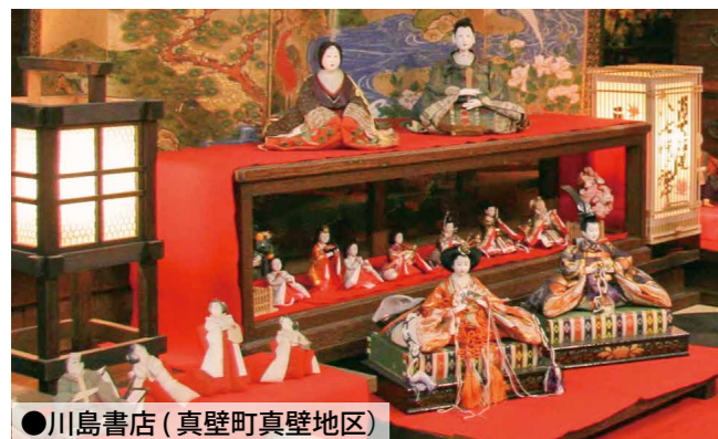
●川島書店(真壁町真壁地区)

【人口】 37,428人 (-104) 【男】 18,562人 (-47) 【女】 18,866人 (-57) 【世帯】 13,517世帯 (-33) ( )は対前月増減 常住人口 令和5年1月1日現在