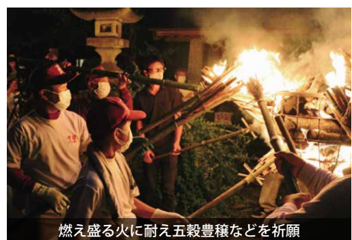
燃え盛る火に耐え五穀豊穡などを祈願

五所駒瀧神社（真壁町山尾地区）で、五穀豊穡や家内安全、疫病退散などを祈る、かっただて祭が行われました。 令和4年度も、感染症予防を徹底し開催され、山尾地区の役員と地元スポーツ少年団の皆さんが参加し、神社のかがり火から神火を松明に灯し、権現山入り口まで運びました。 祭りの最後には、心願成就の奉納花火が打ち上がり、祭りを締めくくりました。