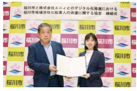
署名した協定書を手にする大塚市長(左)と阿萬代表取締役(右)