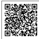
詳しい内容はコチラ

認知症の接し方のポイントや利用できる医療・介護サービスなどをまとめた冊子です。高齢福祉課(岩瀬庁舎)で配付しており、市のホームページでもご覧いただけます。