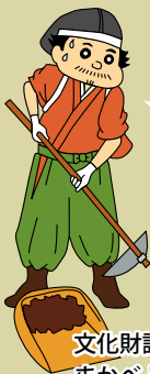
文化財課キャラクター まかべどうむ