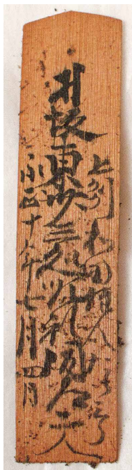
仁王像から 発見された順礼札

また、雨引山薬法寺では平成30年に仁王像の修理をした際、体の中から坂東三十三所の順礼札が3枚発見されました。写真の順礼札には、永正10年（1513年）の日付が書かれており、関東に残る順礼札のなかでも非常に古く、貴重なものとなっています。