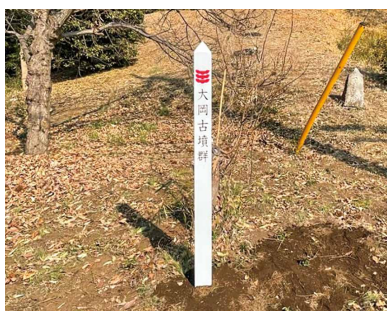
建て替えられた大岡古墳群の文化財標柱

皆さんの身近にも文化財やその標柱があるはずですよ。文化財の名前を知ることができ、ぜひ探してみたいか、いかがでしょうか。