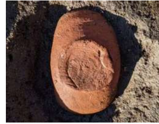
▲耳皿が出土！ (耳の形のはしおき)