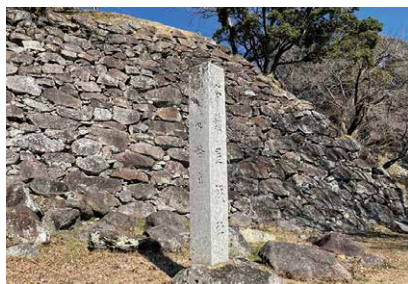
名護屋城の碑と石垣

氏幹も佐竹義宣陣に在陣しており、現地で最新文化を目の当たりにしたのではないかと考えられます。