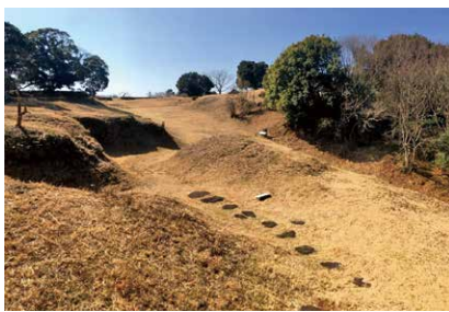
能舞台や茶室が見つかった堀秀治陣跡

これらは、真壁城の庭園の大型建物（御殿）や複数の茶室、池、石組水路などとよく似ており、氏幹も名護屋の地で作庭のヒントを得た可能性があります。