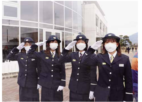
■問合せ・申込先／防災課(☎58-5111・75-3111代表)

■待遇／制服・活動服の貸与、年額報酬・出勤報酬支給、公務災害補償・退職報償金制度