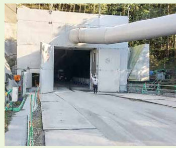
騒音・振動対策のためトンネル坑口に設置されている防音扉

（仮称）上曾トンネルの本体工事進捗状況をお伝えします。 ▼トンネル坑口の状況（桜川工区）