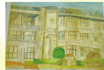
※入選 小池 帆乃霞 (羽黒小6年)