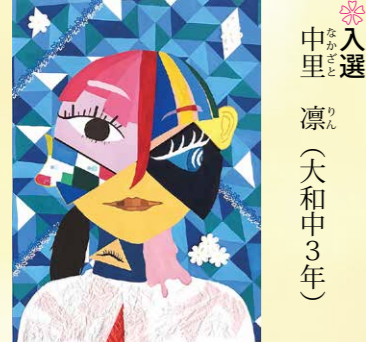
※入選 中里 凛 (大和中3年)