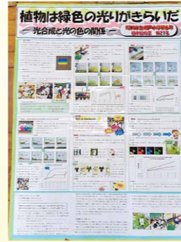
※佳作 植木 絵玲菜 (坂戸小6年) ほか21名