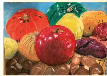
※入選 小島 翠仁 (桃山学園5年)