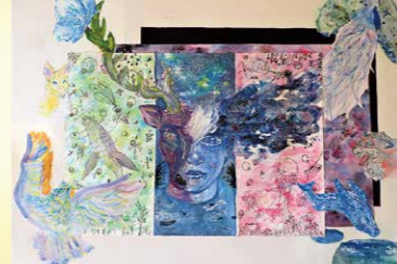
※入選 五十嵐 恵梨果 (岩瀬東中3年)