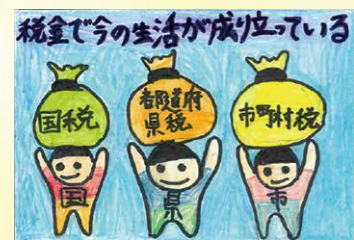
※下館法人会女性部会優秀賞 増淵 琉空 (大國小6年)