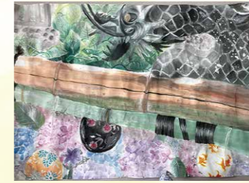
※常陸大和ライオンズクラブ会長賞 飯泉 詩音 (桜川中3年)