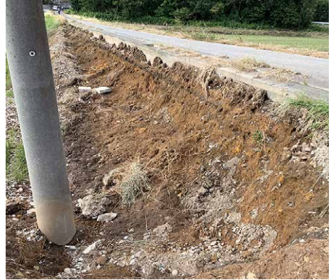
除草剤を使用したことに起因する法面の崩落