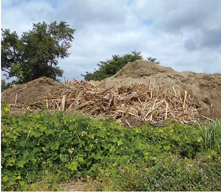
放置され崩れる危険性がある盛土