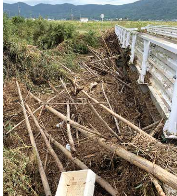
河川へ流出し橋に引っかかった竹や木