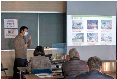
サクラや山桜の魅力を学ぶ