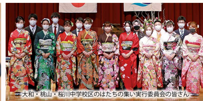
大和・桃山・桜川中学校区のはたちの集い実行委員会の皆さん