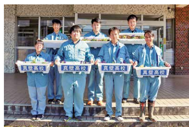
市役所 大和庁舎にピオラを届けた真壁高校の農業科草花コースの皆さん

真壁高校から、農業科草花コースの3年生が育てたピオラが寄贈され、市役所各庁舎の玄関などに飾られました。