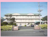
真壁消防署交差点からつづば方面1つめの信号を左折