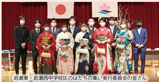
岩瀬東・岩瀬西中学校区のはたちの集い実行委員会の皆さん

【人口】 38,233人 (-74) 【男】 18,934人 (-34) 【女】 19,299人 (-40) 【世帯】 13,489世帯 (-12) ( )は対前月増減 常住人口 令和4年1月1日現在