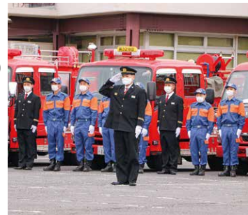
市民の安全を守る覚悟を胸に

1月10日、桜川市消防団出初式が、大和中学校校庭で開催され、市消防団、消防署など関係者約400人が参加しました。