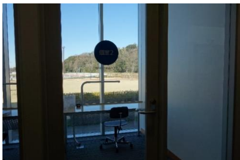
学習室（八千代市立図書館）