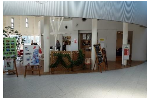
カフェスペース（八千代市立図書館）