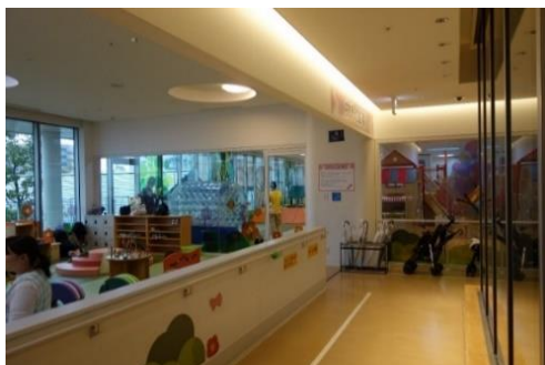
託児施設（大和市文化創造拠点シリウス）