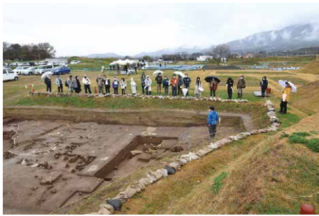
発掘成果を説明会で公開

今回の見どころは、当時の武士が使った城道と庭園の池跡です。真壁氏がつくった城内庭園の全体像が明らかになります。