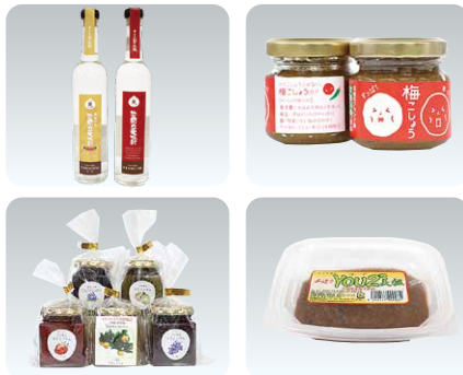
新しく認定された商品の一部