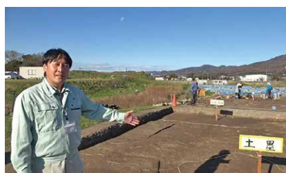
発掘調査の様子を動画でお届け

真壁伝承館歴史資料館では歴史や文化についてさまざまな情報を発信しています。企画展示や歴史講座、指定文化財、収蔵資料、史跡の解説などの情報は市ホームページで見ることができます。また、昨年の現地説明会動画も公開していますので、ぜひアクセスし、ご覧ください。