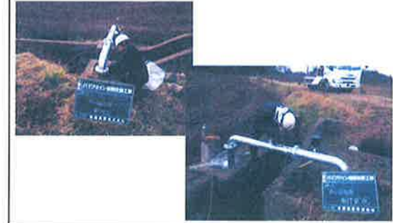
パイプライン修繕工事 【長寿命化活動】