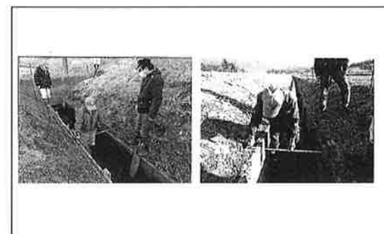
水路の更新工事（検査状況） 【長寿命化活動】