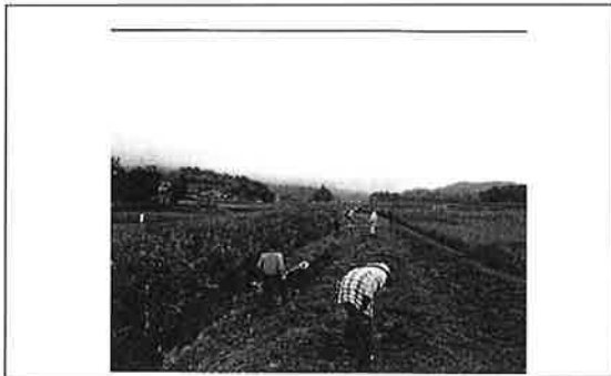
草刈り 【農地維持活動】