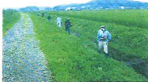
農用地、水路、法面の草刈り 【農地維持活動】