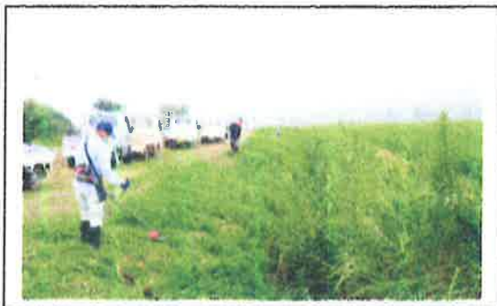
(例) 農用地、水路、法面の草刈り 【農地維持活動】