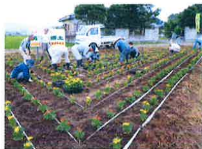
景観形成のための植栽 【共同活動】