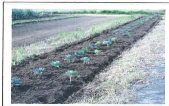
花壇の植栽 【共同活動】