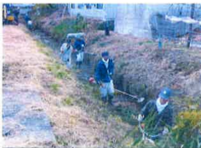
水路の草刈り 【農地維持活動】