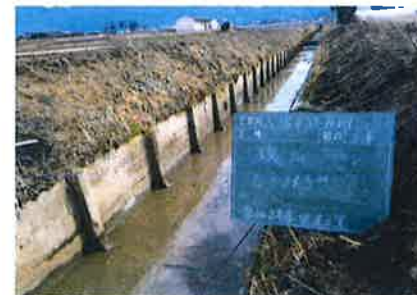
水路修繕工事 【長寿命化活動】