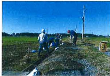
水路泥上げ 【農地維持活動】