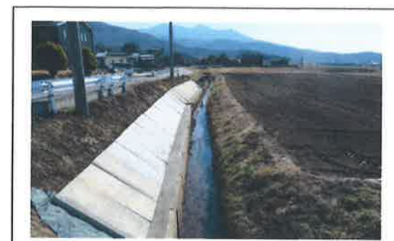
水路の法面コンクリートによる補強 【長寿命化活動】