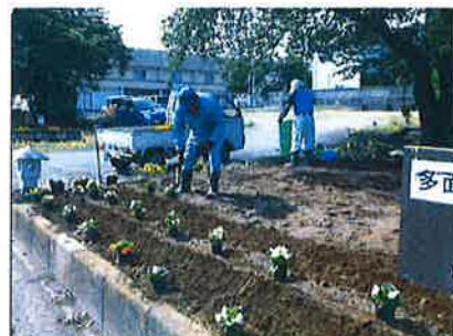
景観形成のための植栽 【共同活動】