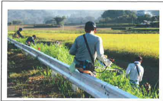
農用地、水路、法面の草刈り 【農地維持活動】