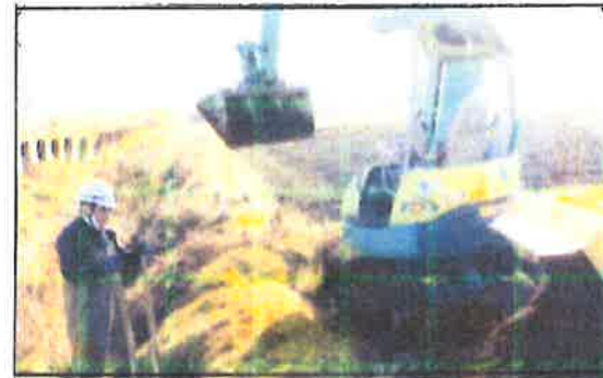
農業用排水路崩落復旧工事 【長寿命化活動】