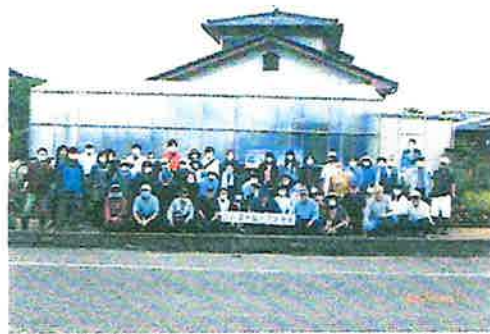
花壇の植栽(春・冬用) 【共同活動】