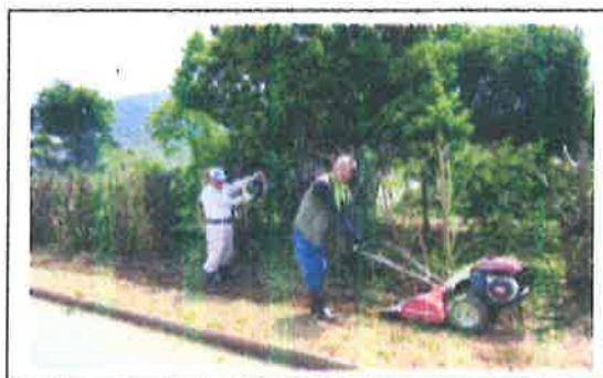
構成団体との啓発普及(花植え)運動 【共同活動】