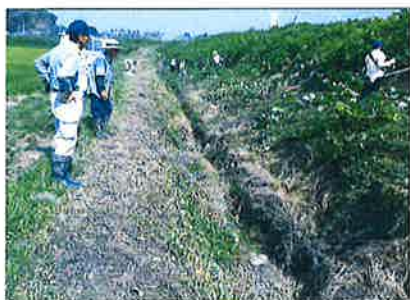
農用地・水路等の草刈り 【農地維持活動】