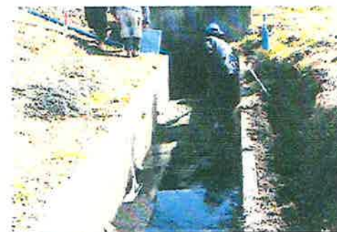
排水路底版コンクリート工事 【長寿命化活動】