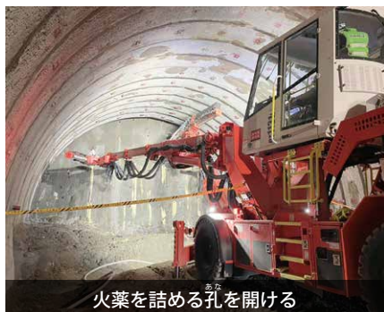
火薬を詰める孔を開ける

現在、トンネル坑口には防音扉が設置され、約93mの地点(5月10日現在)まで掘削が進んでいます。 硬い岩を砕くため「ドリルジャンボ」などの特殊機械や火薬を使用し少しずつ掘り進めながら、一定間隔で鉄製の棒を設置します。さらにコンクリートを岩に吹き付け4mの鉄の棒(ロックボルト)を突き刺して岩を補強します。本体工事は、これらの作業を繰り返し、トンネル全長3,538mのうち約1,600m(桜川工区)を令和4年9月までに完了する予定です。 その後、トンネル設備工事・取付道路整備工事と進め、令和7年度の開通を目指して整備を行っていきます。