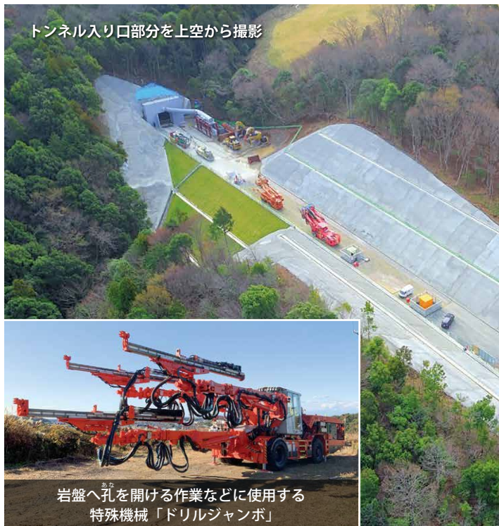
トンネル入り口部分を上空から撮影