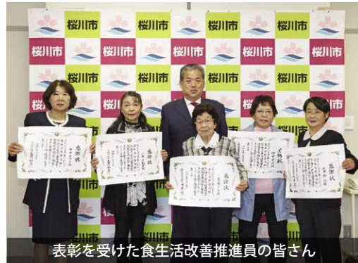
表彰を受けた食生活改善推進員の皆さん

食生活改善推進員とは、食を通じた健康づくりの活動を行うボランティアです。長年、市民の健康への尽力が評価され今回の受賞となりました。