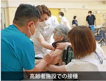
高齢者施設での接種