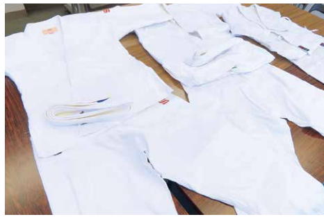
寄贈された柔道着や空手着

今回、県内外から900着を超える道着など（柔道着887着、空手着28着、帯など239点）が3市町に寄贈され、4月14日に同大使館に贈呈を行いました。ダンバダルジャー・パッチジャルガル特命全権大使から、感謝状が贈られるとともに「将来この道着を使用した方からメダリストが誕生したら嬉しい」と期待が寄せられました。皆さまからの寄贈へのご協力ありがとうございました。