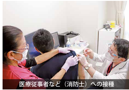
医療従事者など（消防士）への接種

4月26日、医療従事者などを対象とした新型コロナワクチンの優先接種を開始しました。