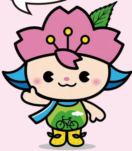
【マスコットキャラクター】