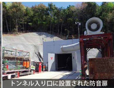
トンネル入り口に設置された防音扉