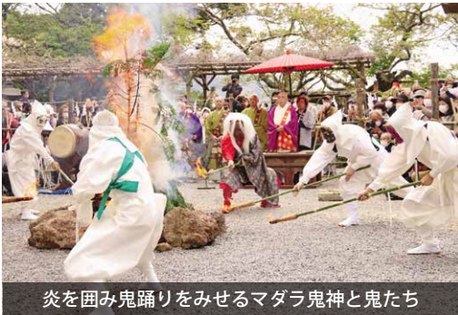
炎を囲み鬼踊りをみせるマダラ鬼神と鬼たち

境内では、マダラ鬼神と鬼たちの鬼踊りが披露され、参詣者からは歓声が上がりました。