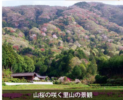
山桜の咲く里山の景観

今年度もすでに3団体から 申請がありました。申請は、 随時受け付けていますので皆