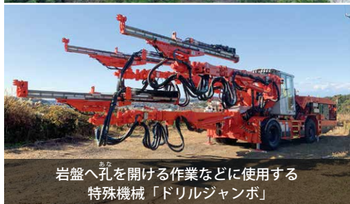
岩盤へ孔を開ける作業などに使用する特殊機械「ドリルジャンボ」