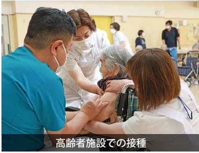
高齢者施設での接種