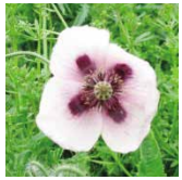
違法なけしや大麻草の例

えていることがあります。疑いのあるものを見つけたときは、最寄りの保健所へご連絡ください。