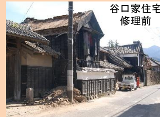
谷口家住宅 修理前