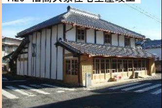
H26 旧高久家住宅主屋竣工

歴史的景観に配慮し、個人宅のブロック塀について板塀にする修景事業を行う。H21～H22