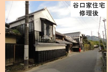
谷口家住宅 修理後