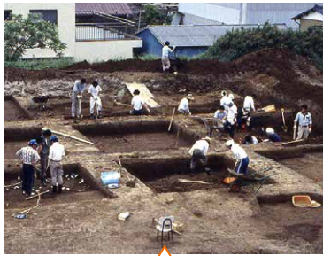
真壁城本丸の発掘風景