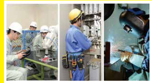
機械システム科 電気工学科 金属加工科