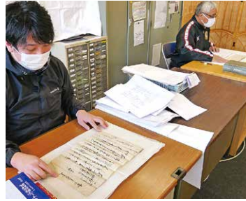
古文書を1点1点整理

写真は、正保2年(1645年)の絵図です。上城地区から雨引山への山道に、①大田伊勢守貞経出城、②応永ノ頃大田貞経本丸跡、③天正