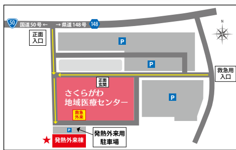
発熱外来棟の位置