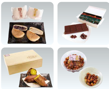
新しく認定された商品の一部