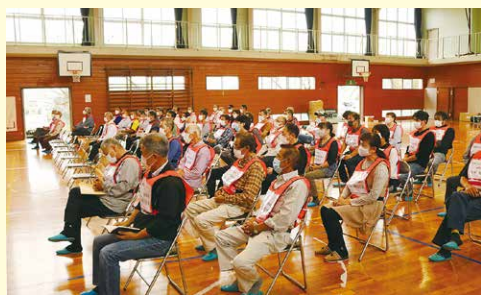
地区防災を考え、多くの地区役員が参加

地区防災組織が設立されている地区を対象に、大規模災害時に円滑な避難所運営を行うための資機材取扱訓練が実施されました。