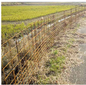
← 侵入防止柵の設置例