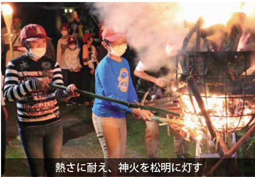
熱さに耐え、神火を松明に灯す

神火を灯した松明の勢いは今年も圧巻で、最後には奉納花火が打ちあがり、祭りを締めくくりました。