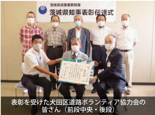
表彰を受けた犬田区道路ボランティア協力会の皆さん（前段中央・後段）

表彰を受けた同会は、長年にわたる道路の美化・清掃活動が認められ、今回の受賞となりました。