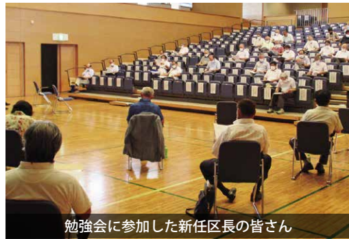
勉強会に参加した新任区長の皆さん