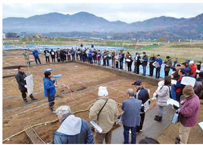
大勢の見学者が訪れた昨年の現地説明会

今年には新型コロナウイルス感染症対策のため、事前申し込みが必要で、必ずお申し込みのうえ、市ホームページなどで最新の情報をご確認ください。