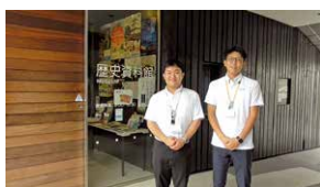
▲各動画のワンカット▼