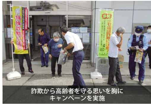
詐欺から高齢者を守る思いを胸に キャンペーンを実施

リーフレットや啓発品を配布し、不審な電話があった場合は、警察や消費生活センターへ相談するよう呼びかけました。