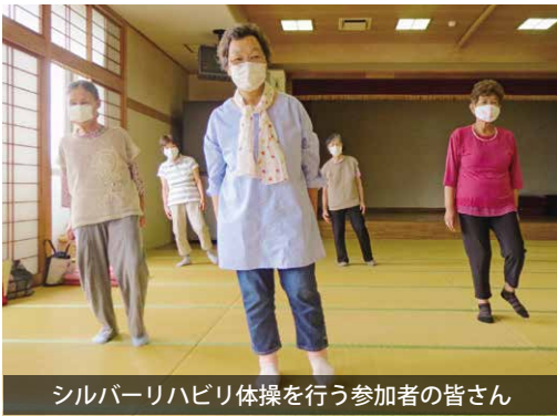
シルバリーハビリ体操を行う参加者の皆さん

当日は16名が参加し、参加者からは「若い人からエネルギーがもらえ、仲間づくりになる」「体操で体が楽になるのがわかる」など喜びの声が聞かれました。