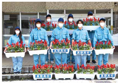
市役所 大和庁舎へサルビアを届けた真壁高校の農業科草花コースの皆さん

真壁高校 から、農業科草花コースの2年生が育てたサルビアが寄贈され、市役所各庁舎の玄関などに飾られました。