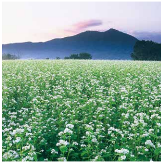
一面に花が咲きほころぶ蕎麦畑

一方で、県内第2位の収穫量を誇る「常陸秋そば」をはじめ、こだますいか、トマト、酒寄みかん、ブルーベリーなど多品種で高品質な農作物が生産されています。