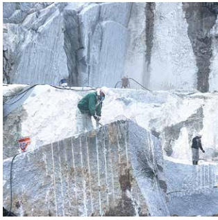
日本有数の花こう岩の採掘場

しかし、担い手の高齢化や後継者不足による農業の停滞、輸入石材の台頭、産業構造やライフスタイルの変化に伴う石材業の衰退により、市の「稼ぐ力」が急速に失われ、その対策が急務となつていま