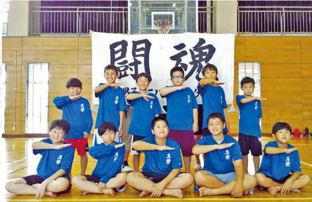
真壁男子ミニバスケットボール スポーツ少年団

僕たち真壁男子ミニバスケットボールスポーツ少年団は、チームがひとつとなるために、いつも「笑顔」で目標に向かって練習に励んでいます。見学・体験は随時受付しています。