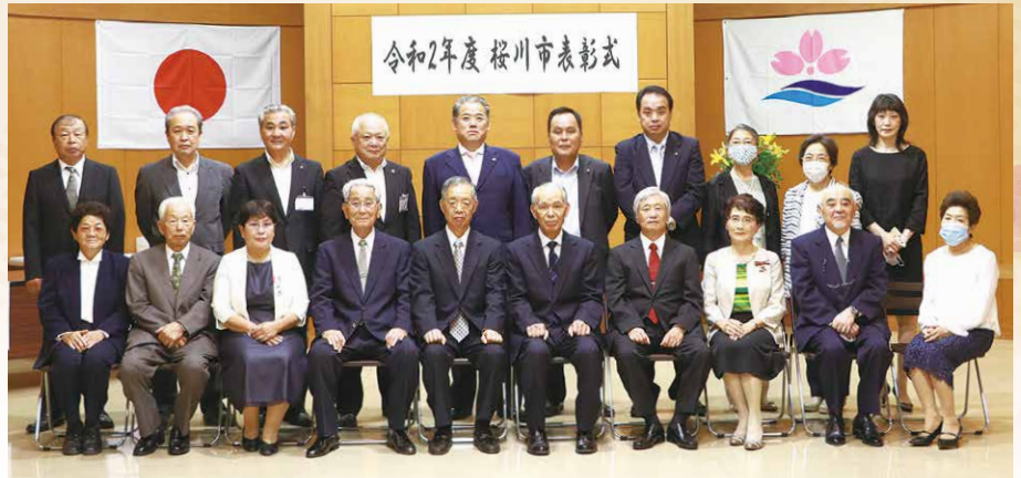
市役所大和庁舎で開催された桜川市表彰式に出席した皆さん