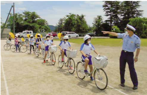
交通ルールや安全な運転の指導を受ける児童たち

児童たちは「交通ルールを守り、安全に正しく自転車に乗り、事故に遭わないように通学します」とこれからの抱負を話していました。